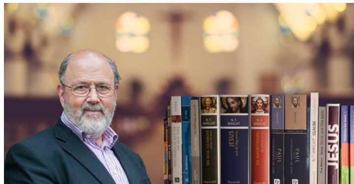
Abbildung 1: www.ntwright.info .

«Du beginnst darüber nachzudenken und realisierst, dass im Zusammenhang mit dem Kreuz immer von einer Art moralischer Prüfung gesprochen wird. Diese Prüfung haben wir alle nicht bestanden und darum müssen wir sterben. Und zum Glück für uns Menschen, musste ein anderer an unserer Stelle sterben,» so Wright. «Es ist besser, diese Version zu glauben als gar nichts zu glauben. Aber es ist schlicht nicht die Art und Weise, wie die Bibel selber die Story vom Kreuz erzählt.»